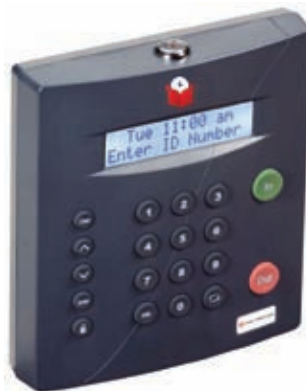
Clock in the Box™